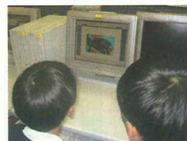
「これはどうしたいの？」 教えあう子どもたち

「グローバルエクスカーション」では、五年生は小笠原、沖縄、北海道、上高地、飛騨高山のうち、子どもたちの希望によりコースを選び、少人数のグループに分かれて先生に引率してもらい夏休みや休日を利用していろいろな体験をします。